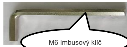
M6 Imbusový klíč

Krok 5: Otevřete klapku, utáhněte šroubovou objímku pomocí imbusového klíče M6.