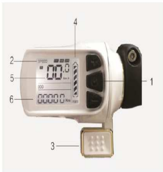
model X1, X5S