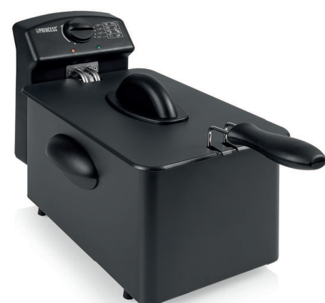
Black Fryer PRO 01.182729.01.001

PARTS DESCRIPTION / ONDERDELENBESCHRIJVING / DESCRIPTION DES PIÈCES / TEILEBESCHREIBUNG / DESCRIPCIÓN DE LAS PIEZAS / DESCRICÃO DOS COMPONENTES / DESCRIZIONE DELLE PARTI / BESKRIVNING AV DELAR / OPIS CZĘŚCI / POPIS SOUČÁSTÍ / POPIS SUČASTÍ / ОПИСАНИЕ ЗАПЧАСТІ