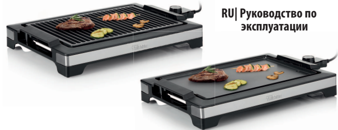
BP-2780 / BP-2781

PARTS DESCRIPTION / ONDERDELENBESCHRIJVING / DESCRIPTION DES PIÈCES / TEILEBESCHREIBUNG / DESCRIPCIÓN DE LAS PIEZAS / DESCRIÇÃO DOS COMPONENTES / DESCRIZIONE DELLE PARTI / BESKRIVNING AV DELAR / OPIS CZĘŚCI / POPIS SOUČÁSTI / ПОИС СОСТАВА ЗАПЧАСТИ