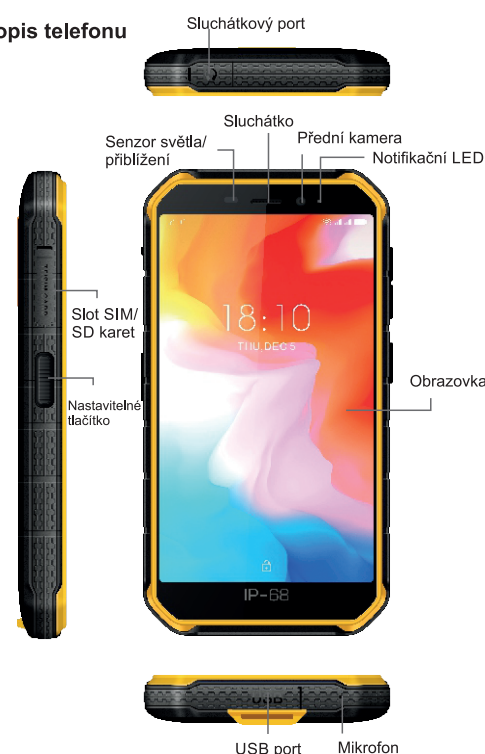
USB port Mikrofon