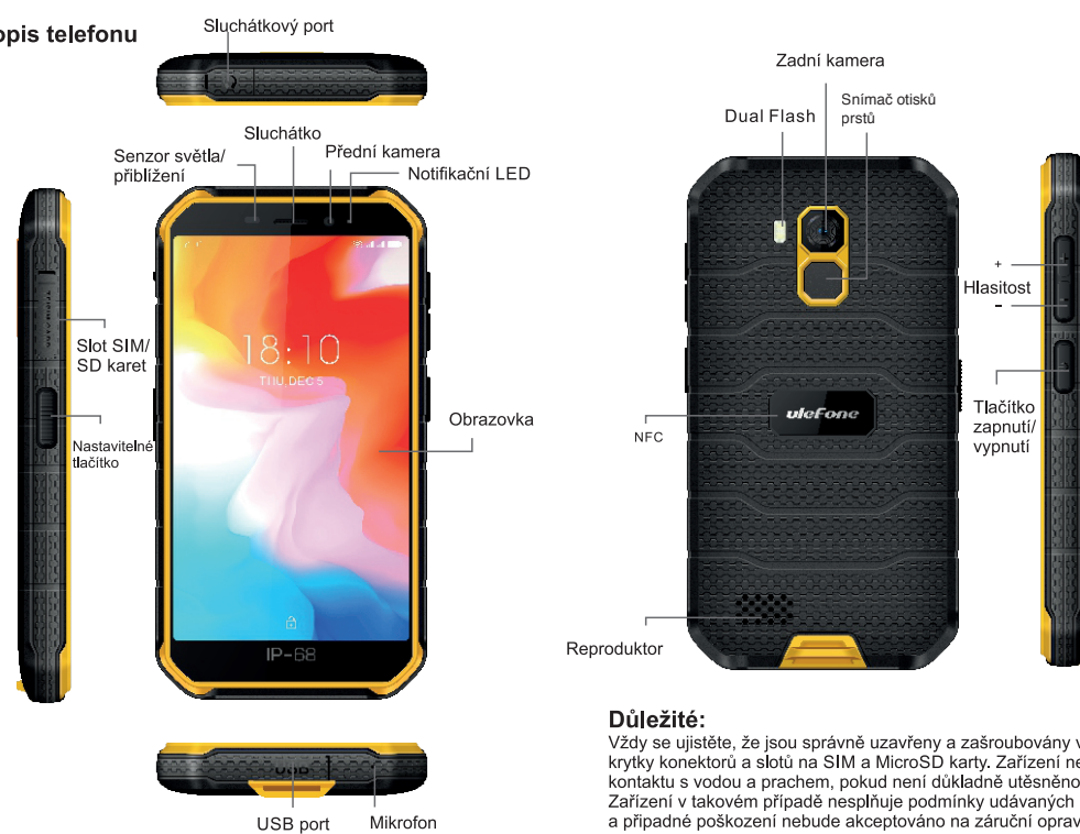
USB port Mikrofon