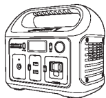
Jackery Explorer 240