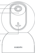
Pohled z přední strany

Slot pro microSD kartu (viditelný když objektiv směřuje nahoru)