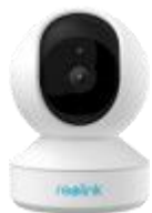
E Series E340 *1