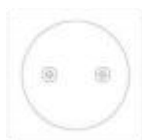
Montážní šablona *1