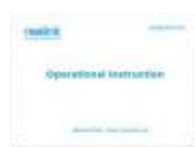
Stručná úvodní příručka*1