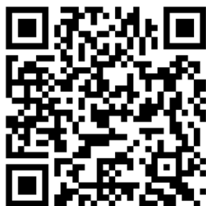
QR kód ke stažení aplikace z Obchodu Play

Aplikace SENCOR SCOOTER je dostupná ke stažení na Obchod Play (Android) a App Store (iOS).