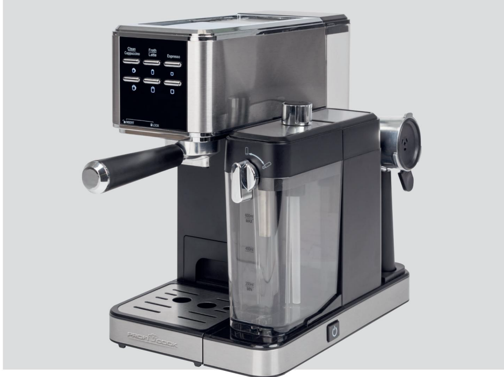
Espresso-Kávovar s pěničem mléka PC-ES-KA 1266