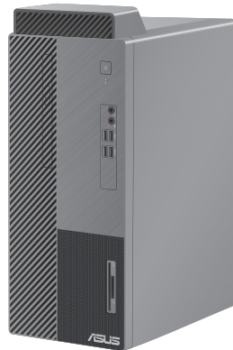
D500MA / S500MA / D500MAES