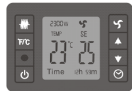
Illustration 1: Панель управления Устройством можно управлять с помощью дисплея или пульта дистанционного управления.